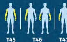
T45 T46 T47

Cada Para atleta usa su propia prótesis hecha a medida para garantizar el mejor ajuste y comodidad.