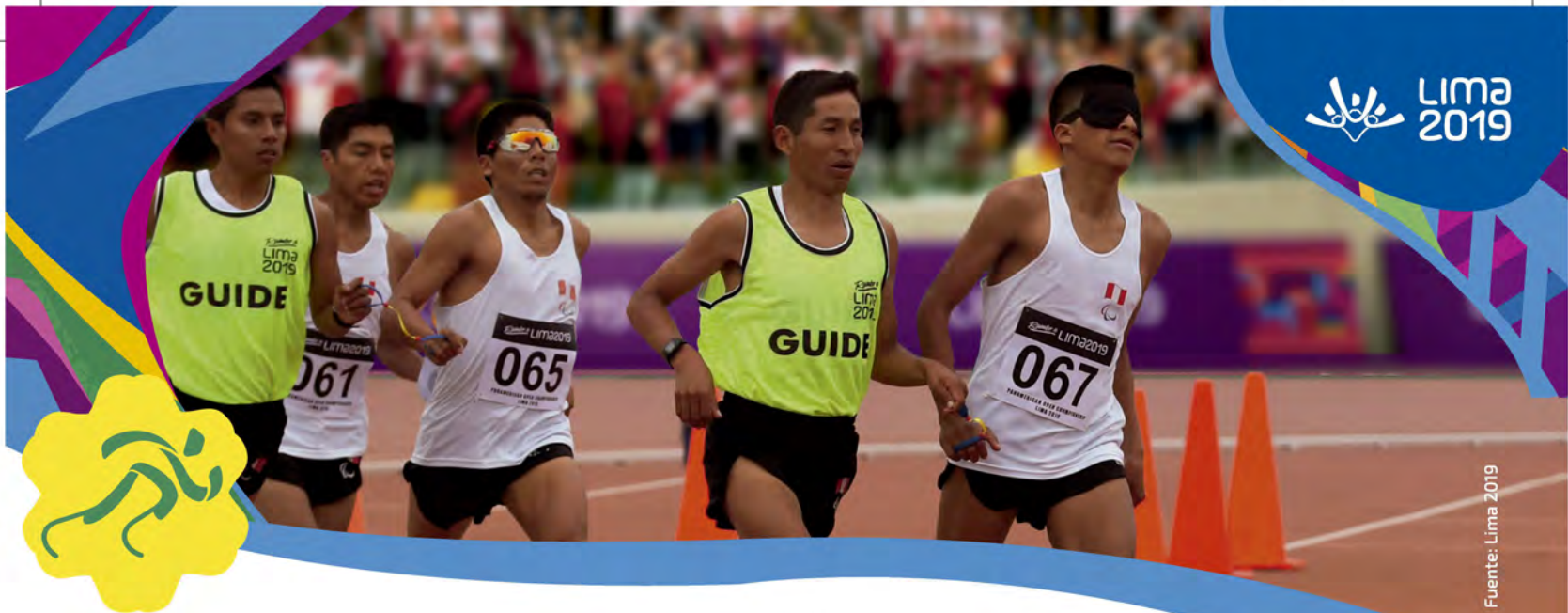
Fuente: Lima 2019